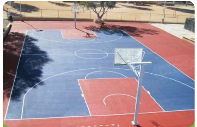
Colegio la Rea, Hermosillo, Sonora

Una excelente opción en superficies deportivas son los sistemas de recubrimiento acrílico que de acuerdo a las diferentes disciplinas y superficies en que se puede emplear, se aplicaran las capas y se complementará con otros materiales, el sistema reduce la temperatura del pavimento y el deslumbramiento conservando un color duradero y una superficie optima para la practica de muchas disciplinas.