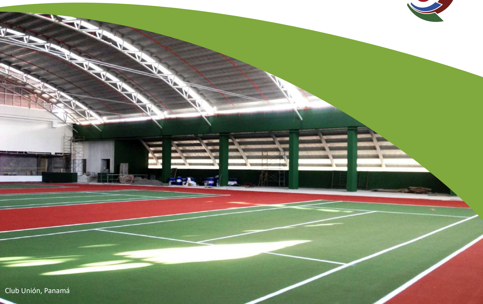
Club Unión, Panamá